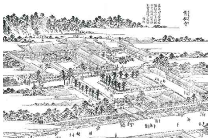
青松寺 『江戸名所図会』巻一 本学図書館蔵

『江戸名所図会』は、江戸とその近郊の絵入りの地誌で、19世紀前半の江戸の景観を知ることができる好資料です。天保5-7(1834-36)年に刊行され、7巻20冊にわたって江戸近郊の神社仏閣・古蹟名所を挿絵とともに挙げ、その現状や由緒が述べられています。