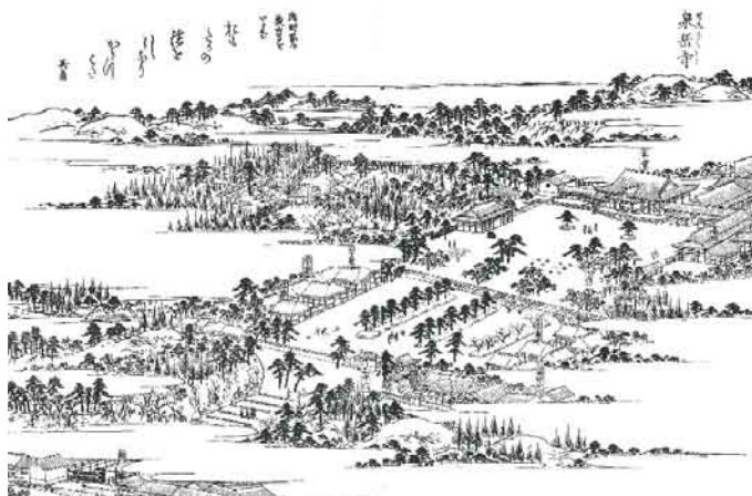
泉岳寺 『江戸名所図会』巻一

江戸神田の名主斎藤幸雄・幸孝・幸成の父子三代によって編纂され、また長谷川雪旦による精緻な描写は、その資料的価値をさらに高めています。