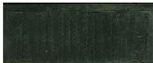
『永平高祖発願文』の版本 当館蔵