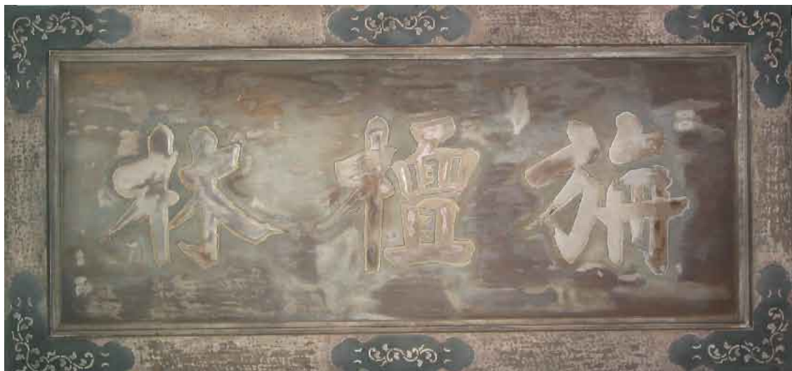
大学史展示室入口の「旃檀林」扁額(複製)

今回の展示に際し、多大なご協力いただいた吉祥寺・青松寺・泉岳寺の各寺院には、厚く御礼申し上げます。